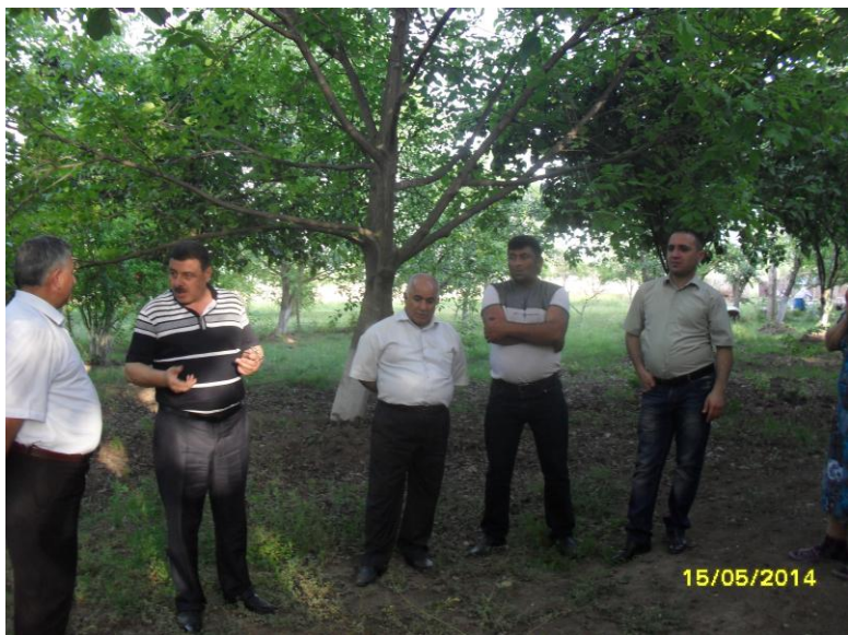
Atagün Elində Amal Bağında söhbət