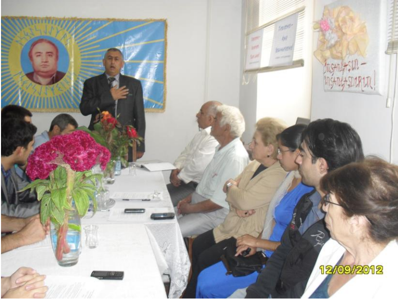
Qutsal “Şərqlilik” Bayramı