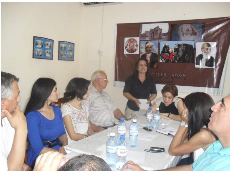
“Qutsal Öyrənim Günü” tədbiri