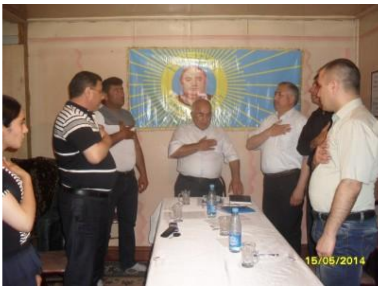
“Atagün” Ailəsinin “Ailə Günü” mərasimi