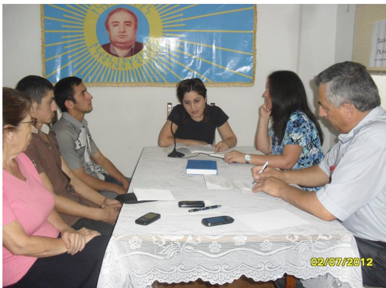
“Ulufərəh” Ailəsinin “Ailə Günü” mərasimi