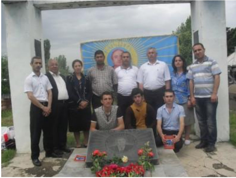
“Ata Sonevini Ziyarət Günü” Mərasimi