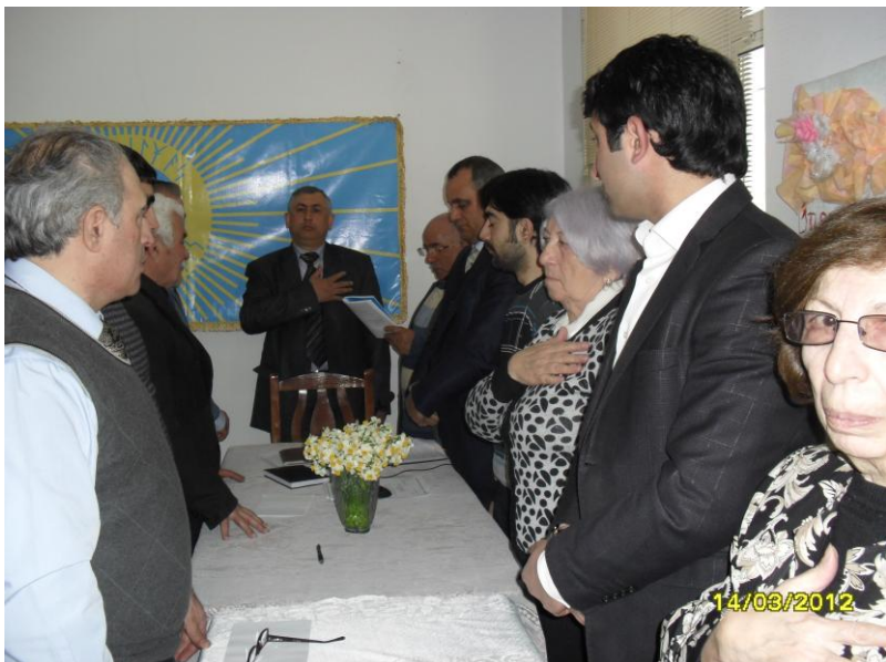
Qutsal “İnsanilik” Bayramı