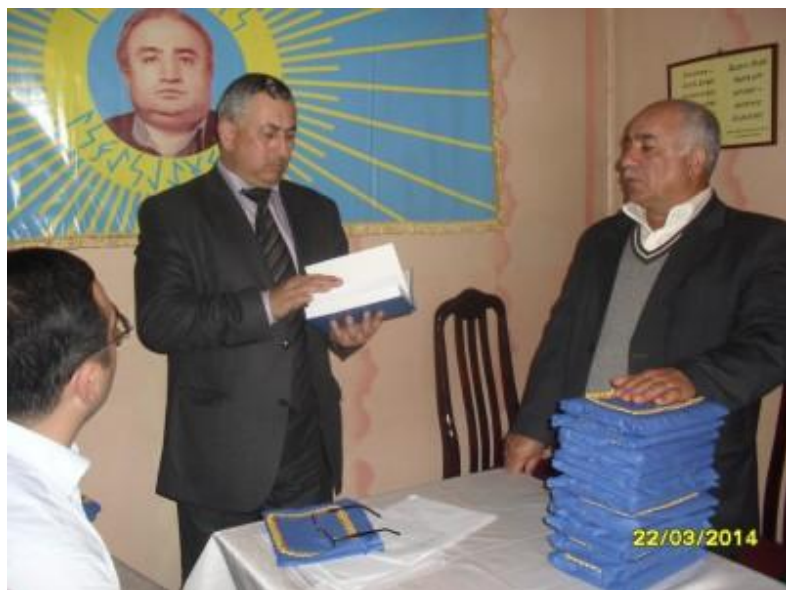
Günev Atalının evinə “Qutsal Bitiqlərin Qəbul Törəni”