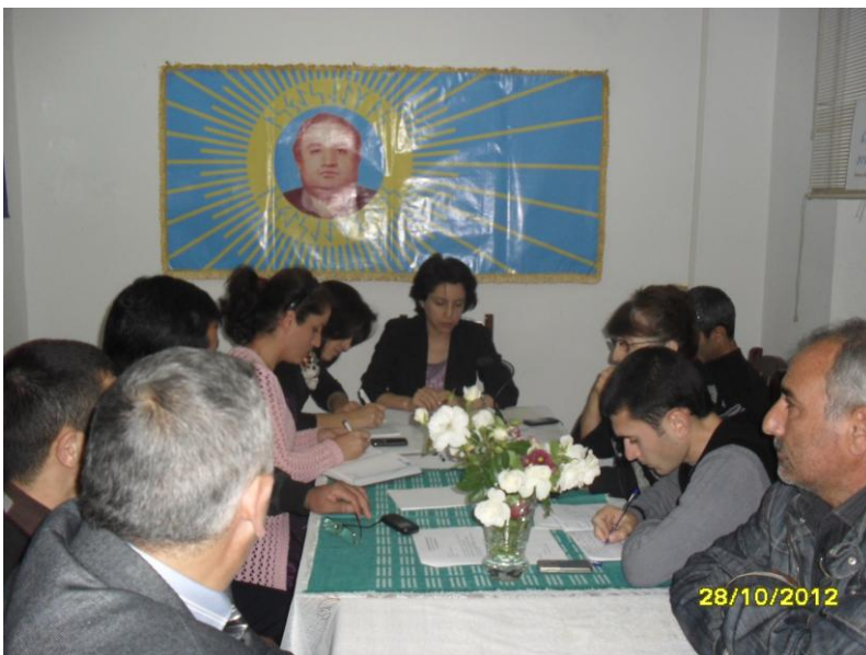
“Uluyol-Hünər” Ailəsinin “Ailə günü” mərasimi