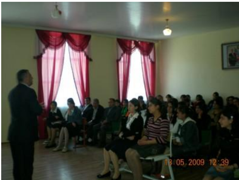
Soylu Atalının Bakı şəhərində orta məktəbdə öyrəncilərlə görüşü