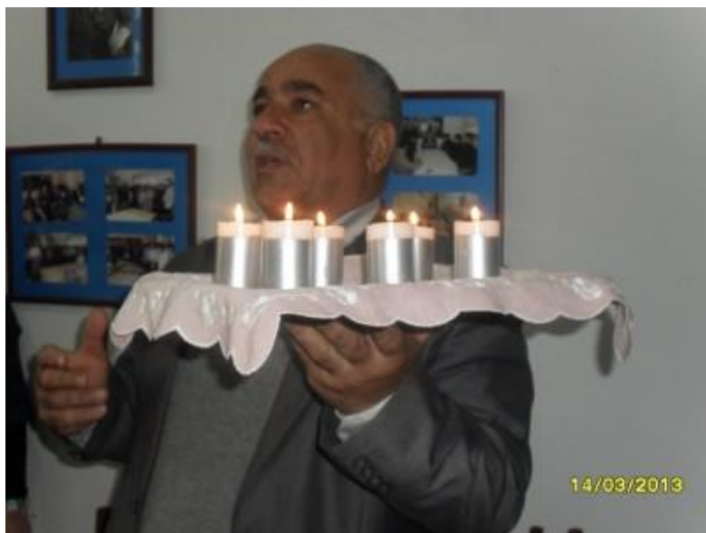
Qutsal “İnsanilik” Bayramı