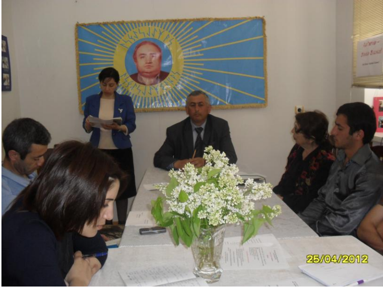
Ocağın “Ruhani İdrak Günü” Mərasimi