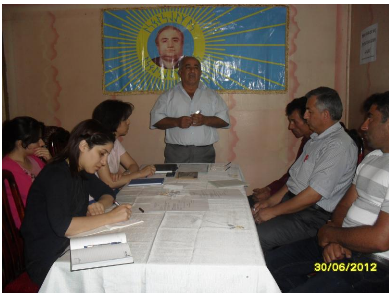
“Atagün” Ailəsinin “Ailə Günü” mərasimi