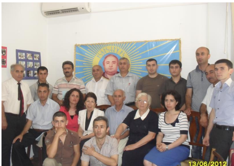
Qutsal “Xəlqilik” Bayramı