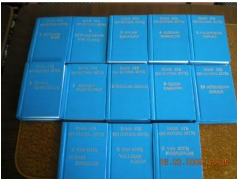
Asif Atanın Qutsal Bitiqləri