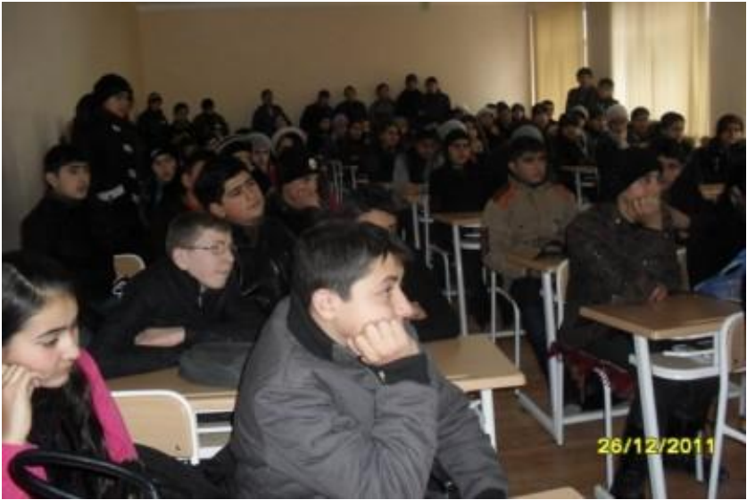
Soylu Atalının Ağstafa şəhərində Orta məktəbdə öyrənci və öyrətmənlərlə görüşü