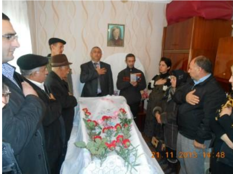
İlqar bəyin xalasının Yas törəni