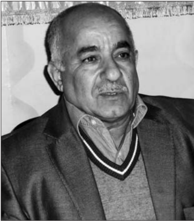
Günev Atalı "Atagün" Ailəsinin Yükümlüsü

Asif Ata Amalının xalqlaşmasının tarixi və ruhani kökləri haqqında danışarkən, mən daha çox haqqım çatan və iştirakçısı olduğum yöndən cavab vermək istəyindəyəm. İkinci bir tərəfdən, Ata Amalının Atagün Elinə gəlişinə, qarşılanmasına və əks münasibətlərin nədən yaranmasına münasibətimi açıqlayıram.