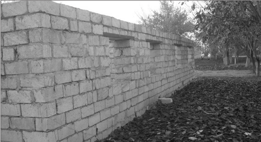
Amal Bağında İnam Məbədinin tikintisi