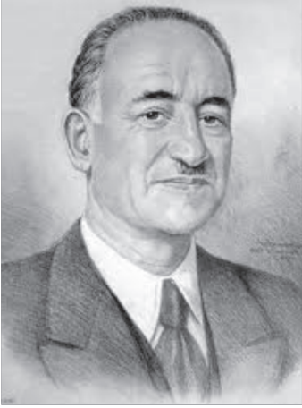
Məhəmməd Əmin Rəsulzadə

Bolşeviklərin nə kimi Doğu politikası uyguladıqları Azərbaycan örnəyində bütün açıqlığı, aydınlığı ilə ortaya çıxmışdır. Bolşeviklər Doğu uluslarının qurtuluşu, dirçəlişi çağırışları ilə sözdə ulusların hüququna, özgürlüyünə, bağımsızlığına sayğı göstərirlər. İşdə isə başqa imperialistlərdən heç də ayrı deyildirlər. Bütün bu anlatdıqlarımızı oxuyan oxucu sözsüz, özünü yeni imperializm qarşısında bulmuşdur: - Qızıl İmperializm!