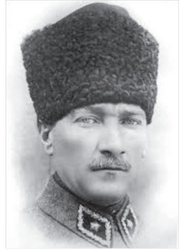
Mustafa Kamal Atatürk

*** Əsgəri hərəkət siyasal çalışmaları umudsuz olduğu nöqtədə başlayır.